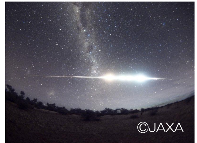
小惑星探査機はやぶさ