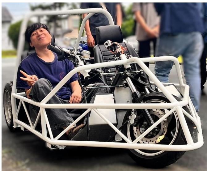
試作モータを搭載した電気自動車