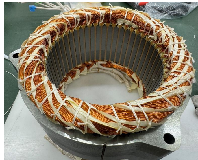
モータ部品の展示・解説