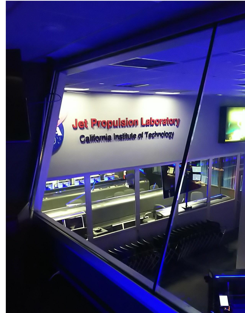
メインホールでの撮影