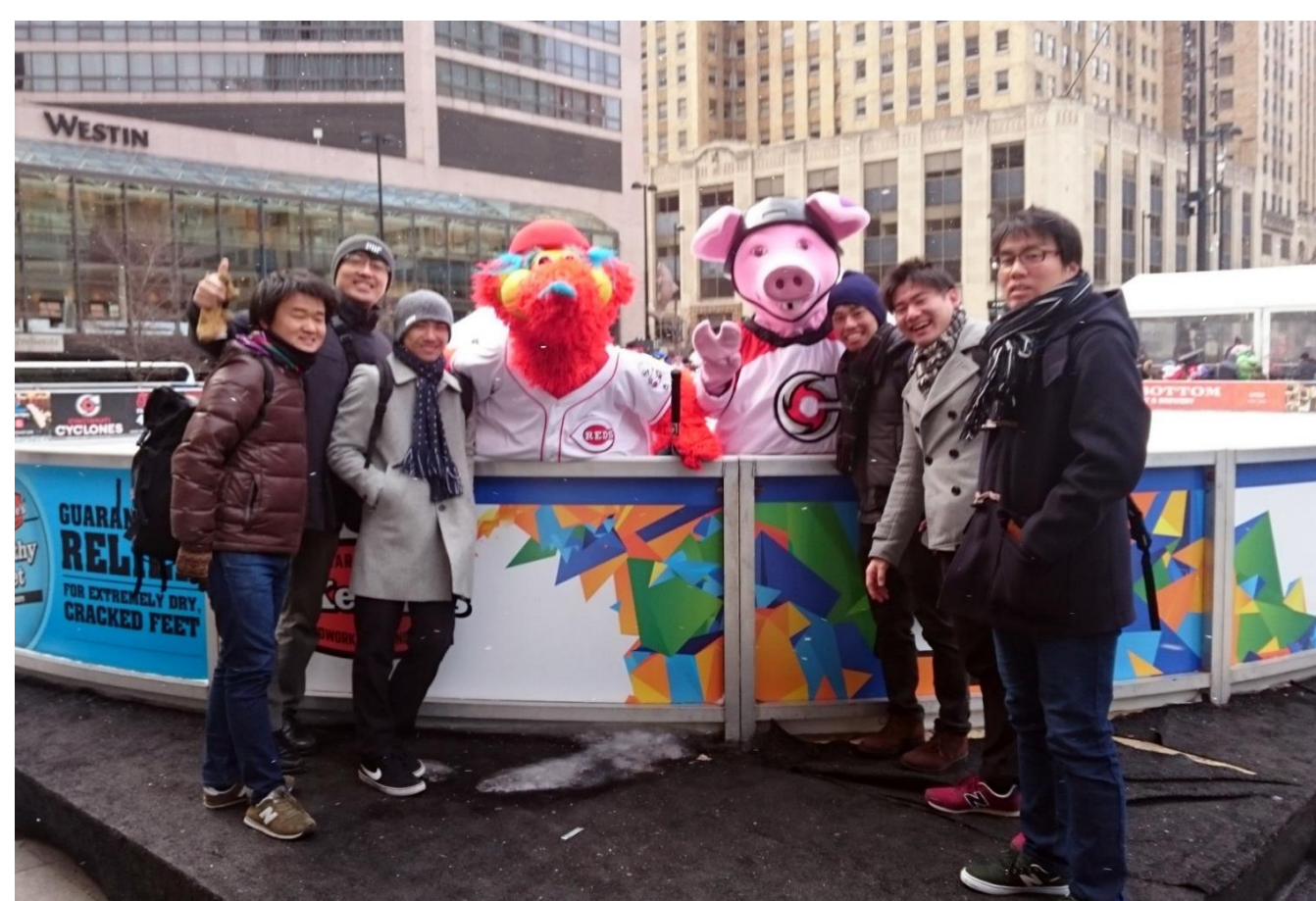
Nano Worldメンバーとの集合写真