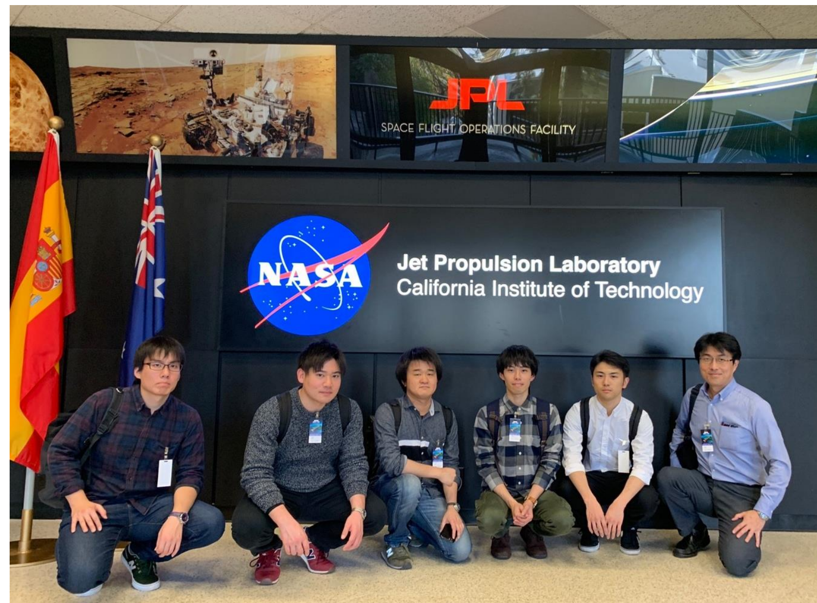
MARS 2020 ROVER組み立ての見学