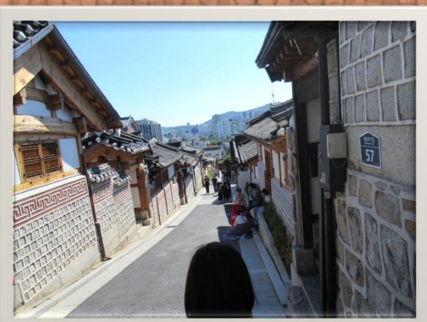
北村韓国村 レトロな街並みを散策