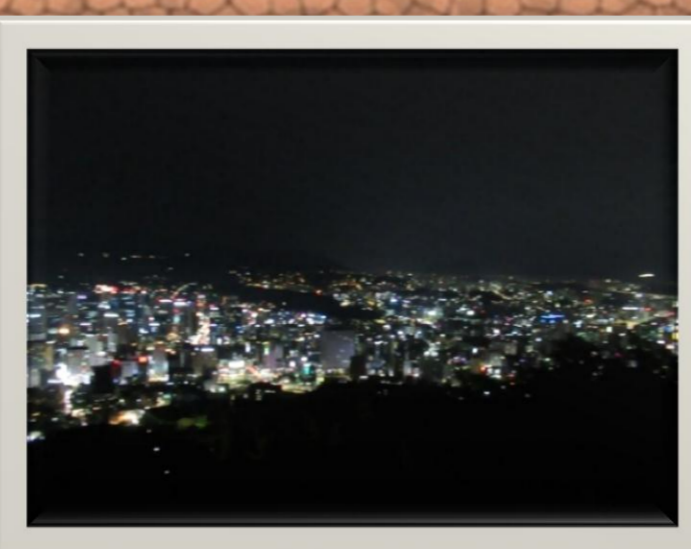
ソウルタワー ソウルの夜景が一望!