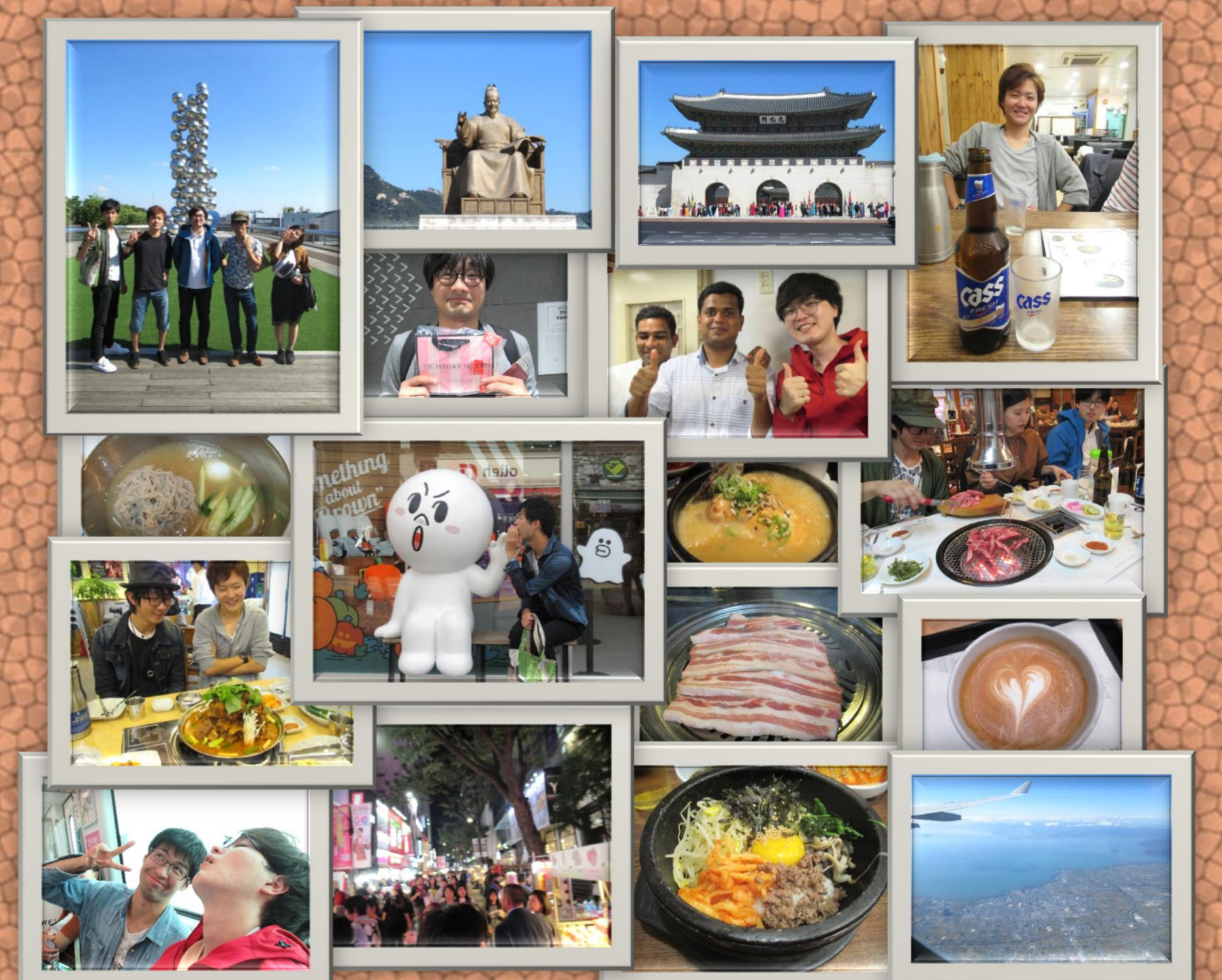
その他オフショット