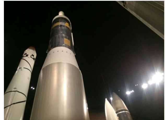
戦闘機, ロケットの歴史など