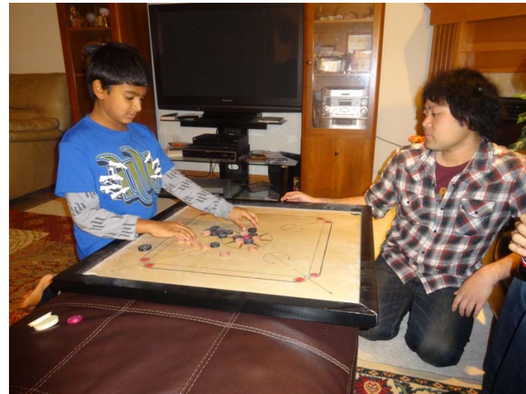
ジェイ先生のお子さんとゲーム