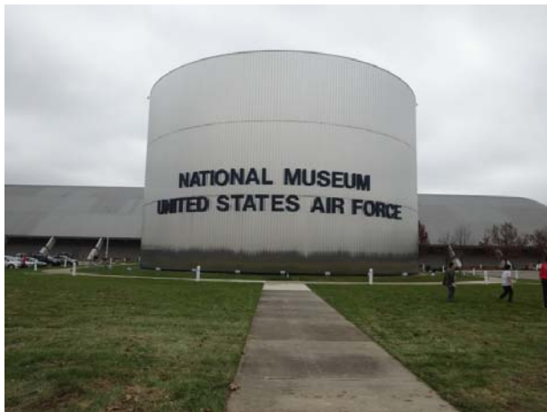
国立米空軍博物館