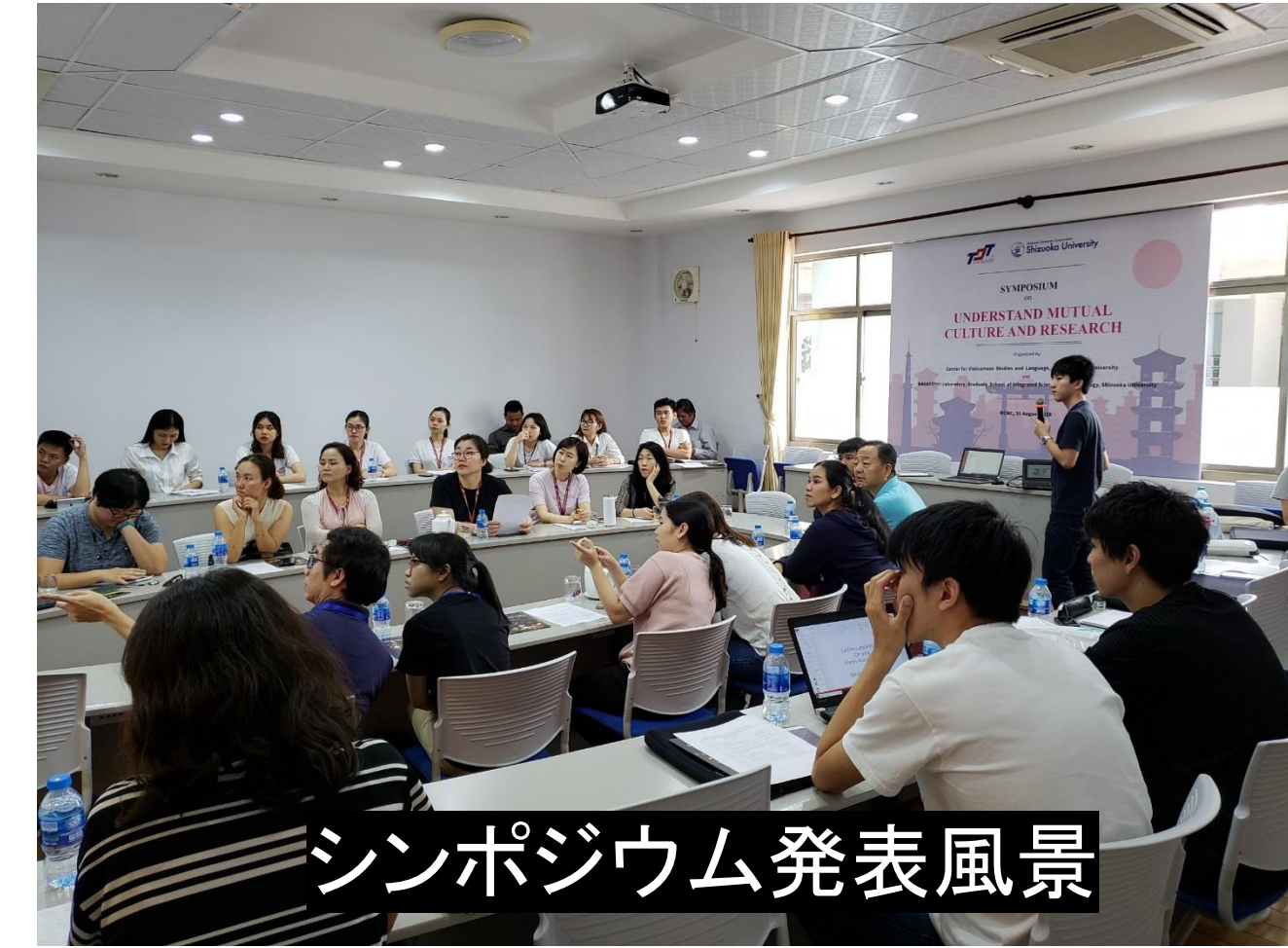
シンポジウム発表風景