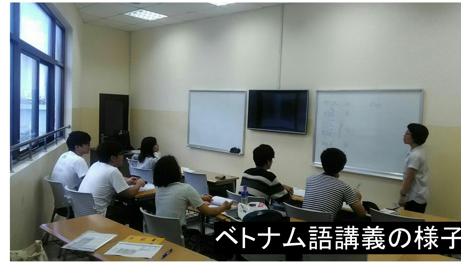
ベトナム語講義の様子