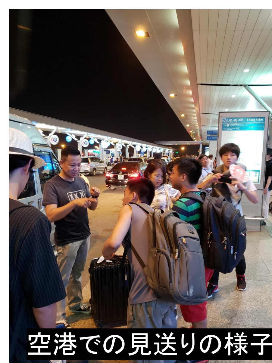
空港での見送りの様子