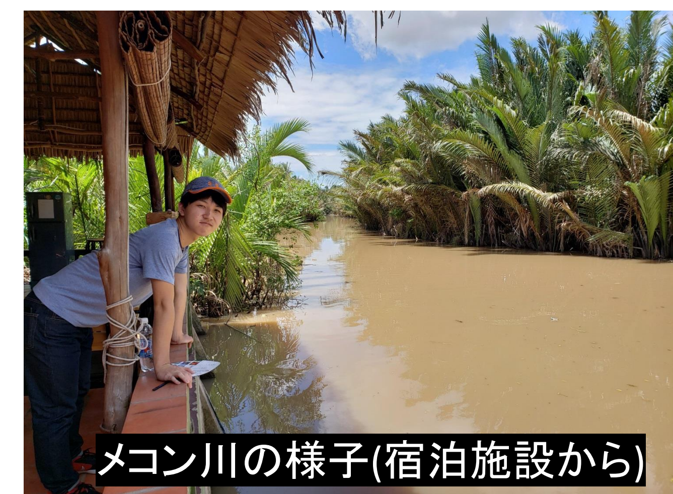
メコン川の様子(宿泊施設から)