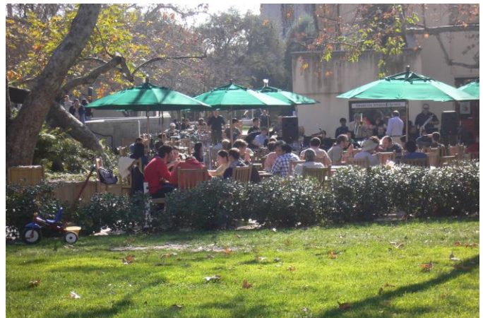
オープンスペースでのグループランチ

してII族シリサイド半導体の熱電素子への応用を試みているところである。そこで新規II族シリサイド半導体からなる熱電素子の開発をJeffグループに提案し研究室を訪れる事となった。滞在中にはカルシウムシリサイドの作製と評価を行う事とし、予め研究室にて作製した \text{Ca}_2\text{Si} を基とした粉末材料をCaltechにて評価するとともに、メカニカルアロイング法によりカルシウムシリサイドを基とした化合物を作製し熱電特性を評価した。